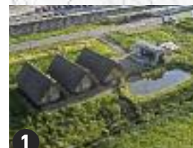
1 Information Pavilion/ Pile dwelling Pavillon d'information/Palafittes Pabellón de información/Palafito