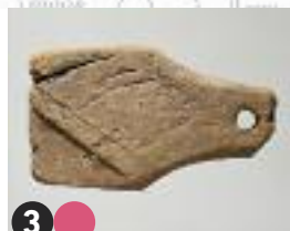
3 Art and ritual objects Objets d'art et à fonction culturelle Objetos de arte y del culto