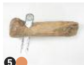
5 What waste may tell La parole est aux déchets Lo que cuentan los residuos